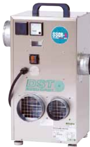
Recusorb DR-010B från Seibu Giken DST är en robust sorptionsavfuktare i rostfritt stål. Naturligtvis är den konstruerad med intern energiåtervinning för bästa driftsekonomi.

De byggnadsfysikaliska sakförhållandena i denna broschyr är kontrollerade av Sveriges Provnings och Forskningsinstitut (SP). Seibu Giken DST AB utvecklar och tillverkar luftavfuktare. DST har ett av marknadens bredaste sortiment med avfuktare i alla storlekar, från små avfuktare för husgrunder till skräddarsydda aggregat för processindustrin. Avfuktare från Seibu Giken DST används världen över för skydd mot korrosion, kondens, frostpåväxt och andra fuktproblem. Läs gärna mer om oss på www.avfukta.nu eller www.dst-sg.com